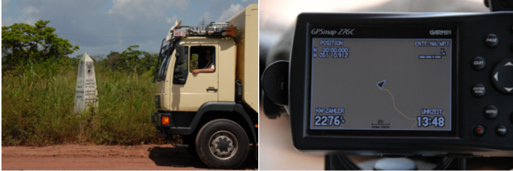
00°00.000 genau am Äquator