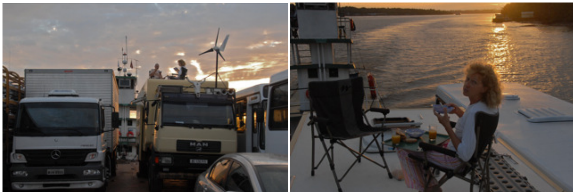
Frühstück auf dem Amazonas

Wir fahren also in dunkeln von Belem ab, schade aber nicht zu ändern. Endlich sind wir unterwegs, die Fahrt von Belem nach Macapá dauert ca. 36 Stunden und geht ca. 30 Stunden durch ganz enge Passagen, bevor sie kurz vor Macapá in einen Hauptarm vom Amazonas führt.