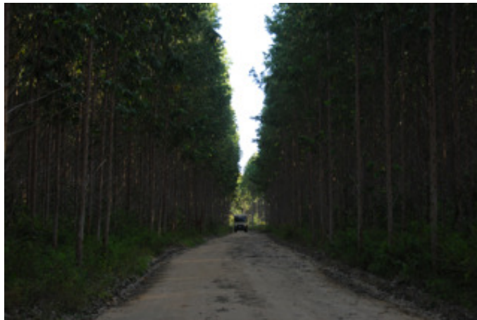
Eukalyptuswälder so weit das Auge reicht für die Zellulose Industrie

Macapá – Oiapoque, 580 km sind es nur und bei dieser Strasse dürfte dies in zwei Tagen zu schaffen sein. Wir sind ja inzwischen sehr hoch oben im Amazonas und schlafen erstmals in der typischen Amazonasvegetation. Doch komischerweise hat es überhaupt keine Tiere, keine Affen, Vögel, Schlangen und auch die sonst so auf unser Blut geilen Moskitos in der Grösse von kleinen Mistkratzerlis, (kleine ca. 2 Monate alte Hühnchen) die sich sonst an unser Moskitonetz hängen und um Einlass bitten, fehlen hier total. Vermutlich hatten die die Einsamkeit satt und sind ausgewandert.