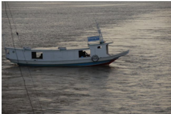
Schulbus ohne Räder